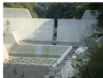
f) Proposed fishway installed in slit-type Sabo dam (14m height)