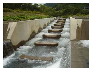
c) Ice-harbor type weir