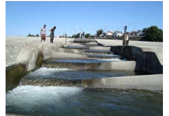
d) Half-corn weir