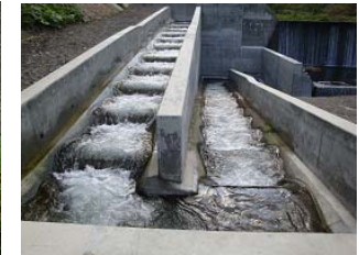
d) Switchback type fishway with a trapezoidal section