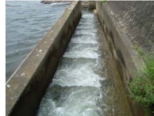
c) Pool-type fishway with a half trapezoidal section