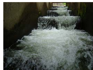
a) Pool with vertical weir