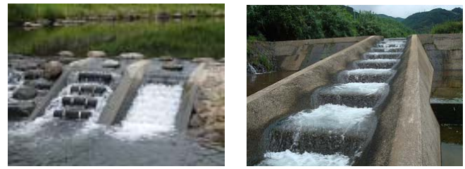
a) Eco-step fishway (Stream type fishway)